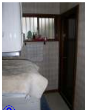
窮屈な感じがする 脱衣室でした。